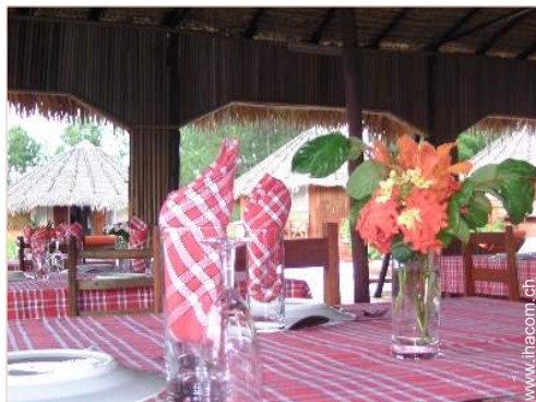
Bungalow mit Charme

Besondere Vorzüge : Direkter Zugang zum Strand