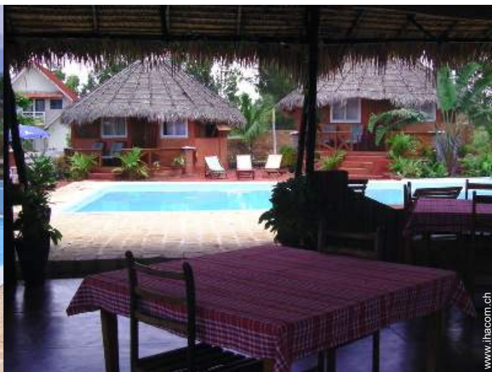
Bungalow mit Charme