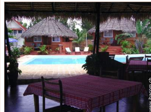
Bungalow mit Charme