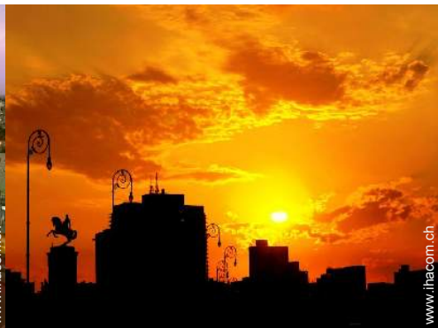
Blick auf Denkmal