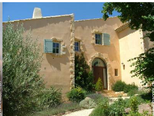
exklusives provenzalisches Haus