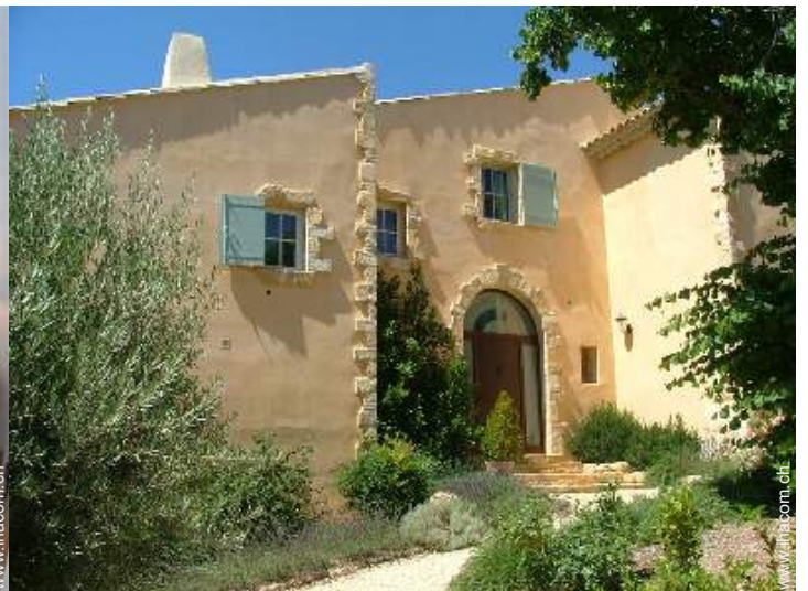
exklusives provenzalisches Haus