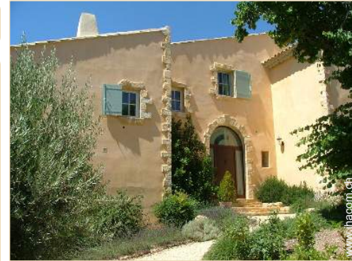
exklusives provenzalisches Haus