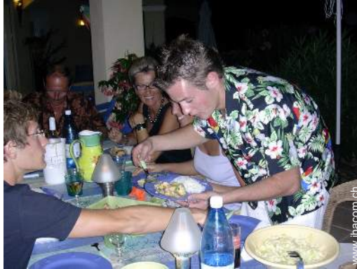
Table d'Hôte (Gemeinschaftstafel)