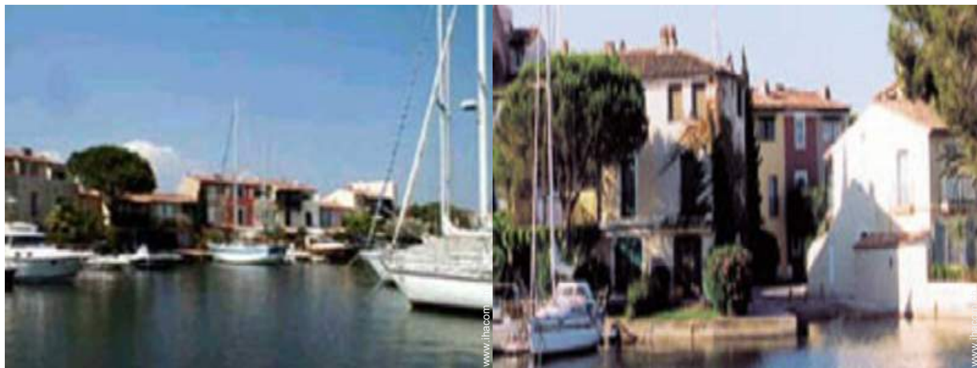
Blick auf Platz