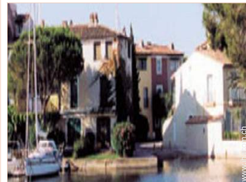
Blick auf Platz