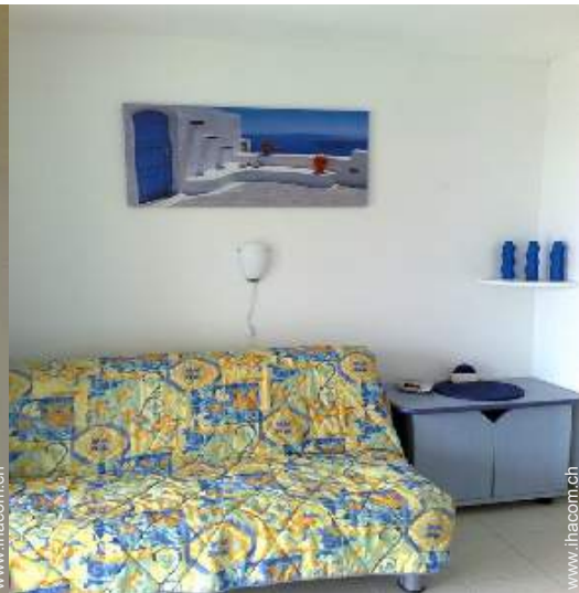
Sofabett(en) 2 Personen