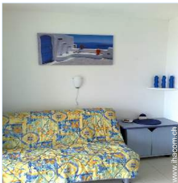
Sofabett(en) 2 Personen

Besondere Vorzüge : Direkter Zugang zum Strand