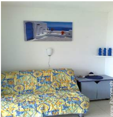
Sofabett(en) 2 Personen