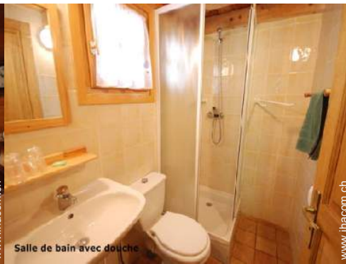
Salle de bain avec douche