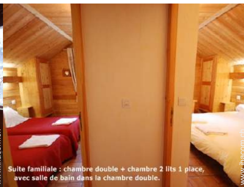
Suite familiale : chambre double + chambre 2 lits 1 place, avec salle de bain dans la chambre double.