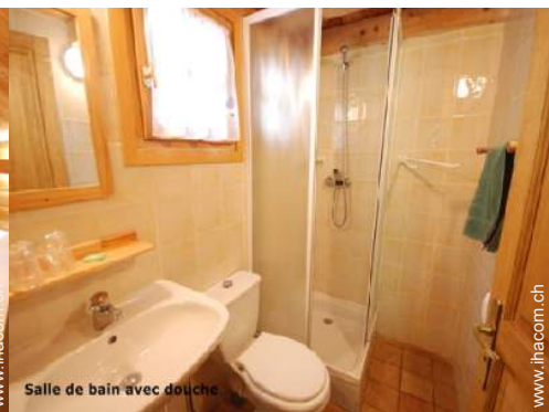
Salle de bain avec douche