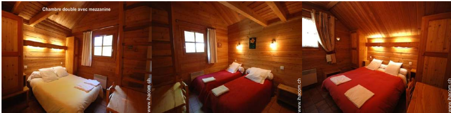
Chambre double avec mezzanine