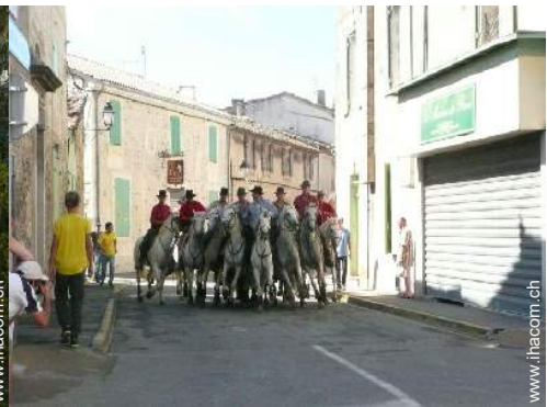
Attraktionen und Entspannung