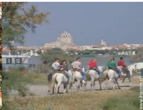
Sommeraktivitäten in der Nähe