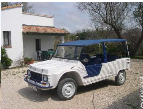
Vor Ort anwesend