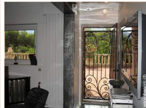
Apartment mit Charme