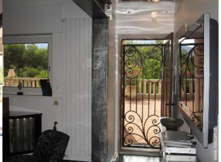
Apartment mit Charme