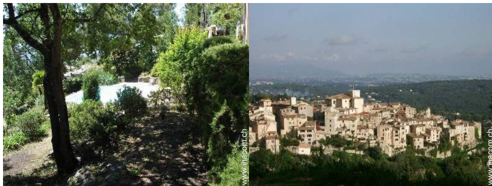
Blick aufs Land