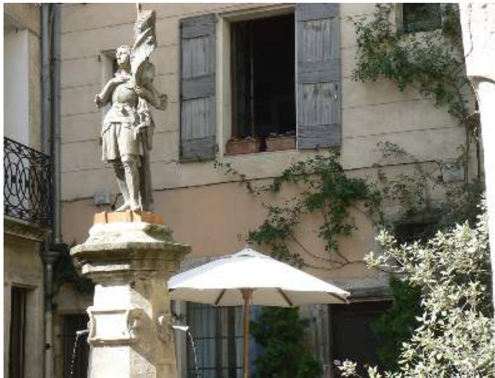
Steinhaus mit Charme