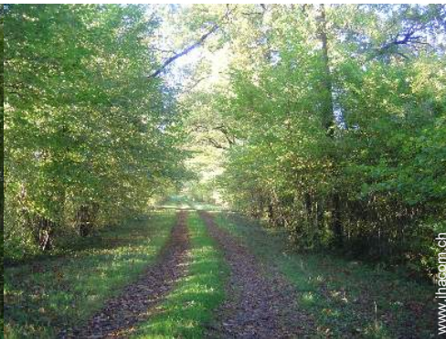
Äußerer Rahmen zur Verfügung der Gäste