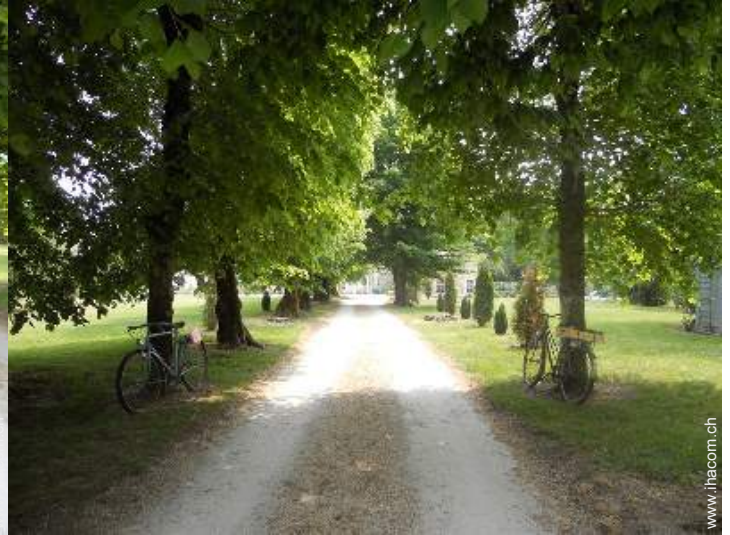
Anwesen mit Charme