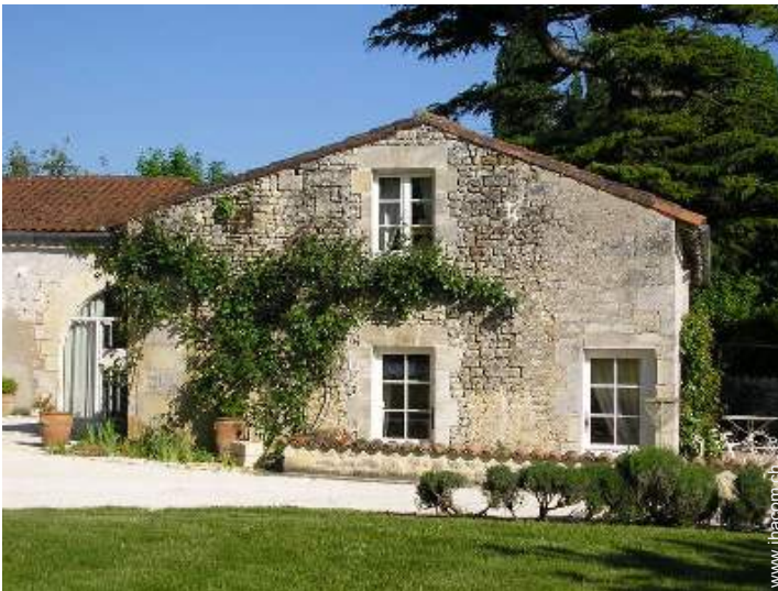
Haus mit Charme