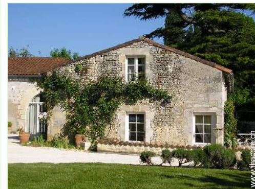
Haus mit Charme