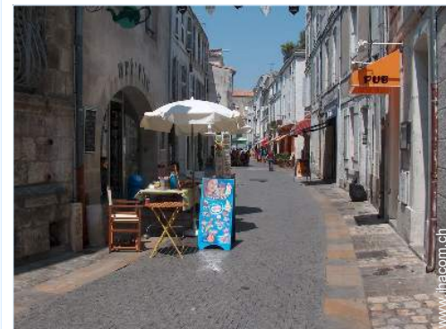
Blick auf Fußgängerzone