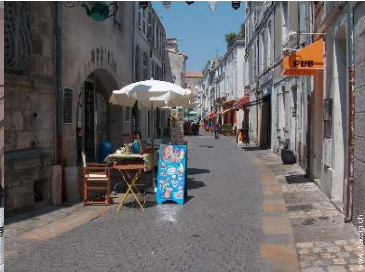
Blick auf Fußgängerzone