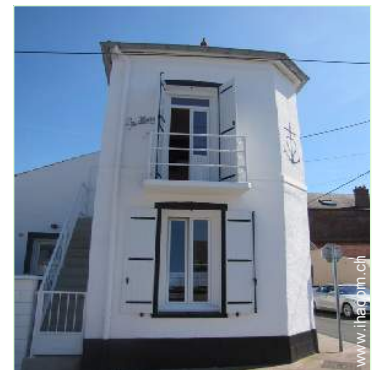
Haus mit Charme

- Stadtzentrum 300m - Fahrrad-/Mountainbikeverleih 500m - Ortliche Geschäfte 500m - Apotheke 500m - Arzt 500m