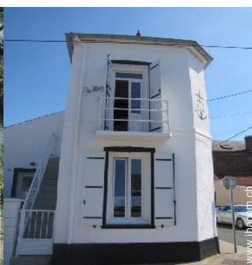
Haus mit Charme