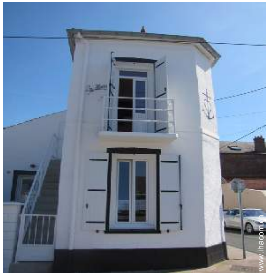
Haus mit Charme