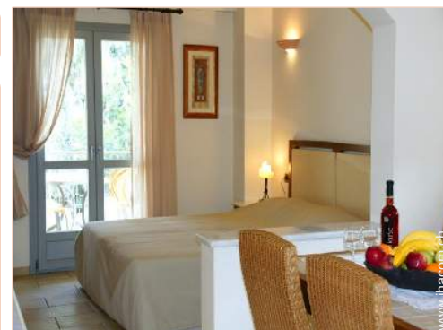
Maisonnette mit Charme