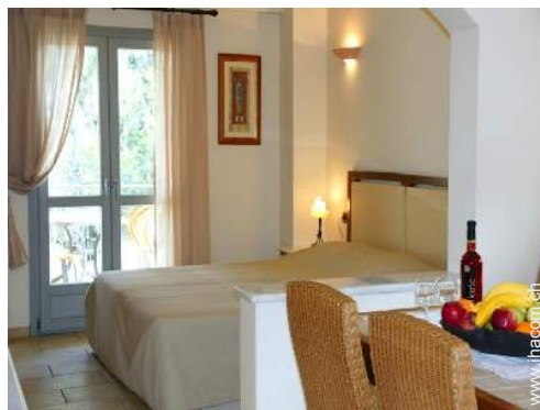
Maisonette mit Charme