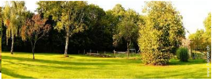
Blick auf Garten/Park