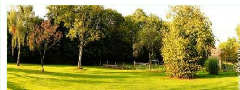
Blick auf Garten/Park