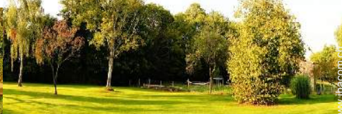
Blick auf Garten/Park