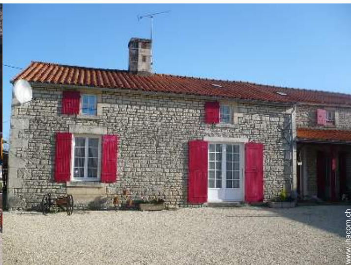
ehem. Bauernhaus mit Charme