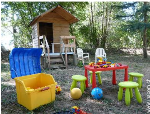
Außenausstattung zur Verfügung der Gäste