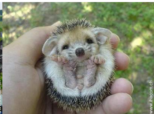
Park und Garten