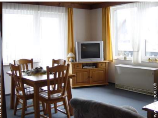
Innenkomfort und Ausstattung