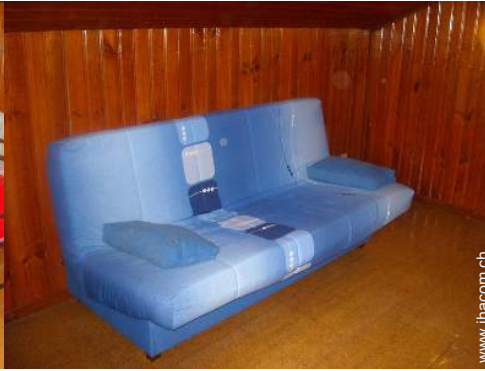
Schrankbett(en) 2 Personen