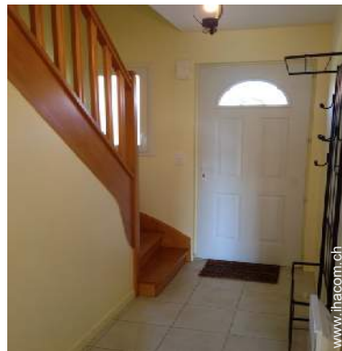
Innenkomfort zur Verfügung der Gäste