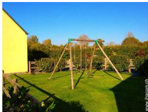
Außenausstattung zur Verfügung der Gäste