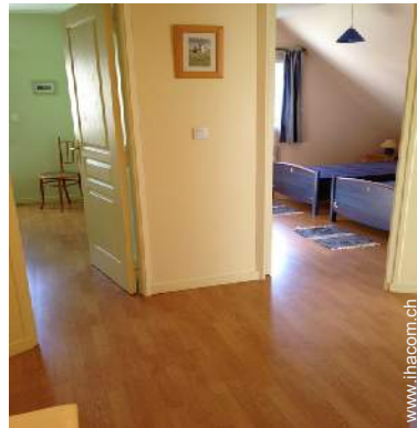
Innenkomfort zur Verfügung der Gäste