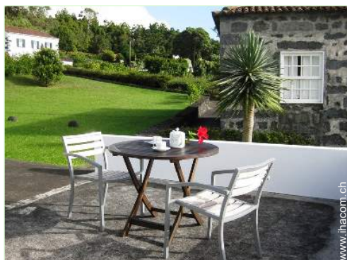
Außenausstattung zur Verfügung der Gäste