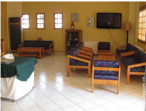
Wi-Fi (drahtloser Internetzugang)