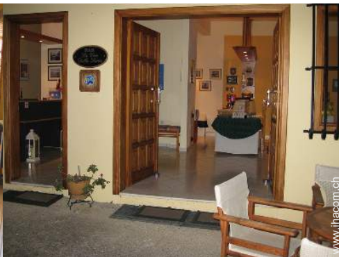
Wi-Fi (drahtloser Internetzugang)