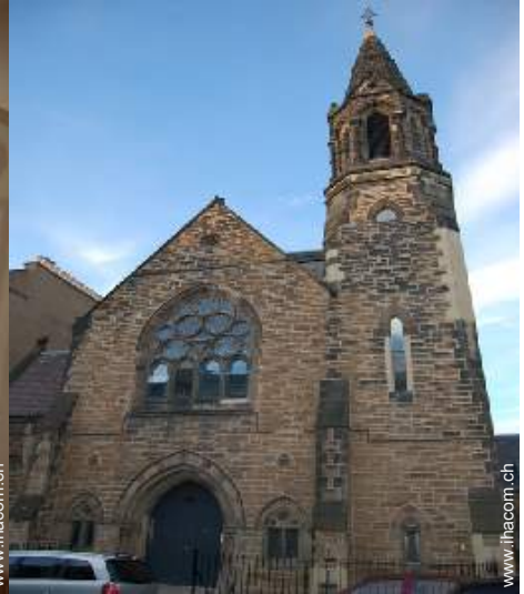
ehem. Kapelle mit Charme