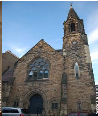
ehem. Kapelle mit Charme