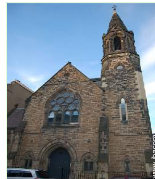
ehem. Kapelle mit Charme