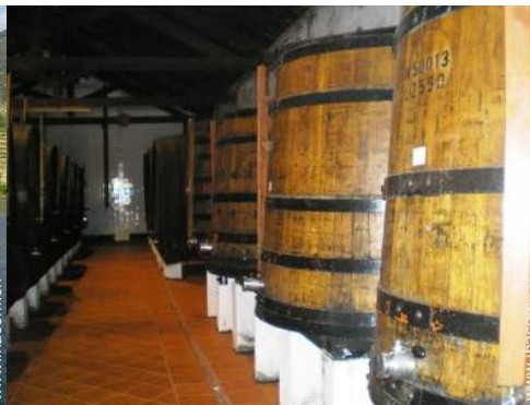
Weinkeller und Weindegustation