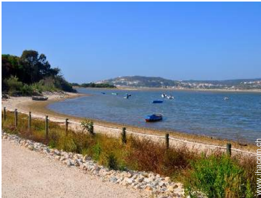
Blick auf See