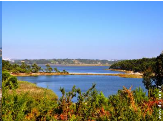
Blick auf See