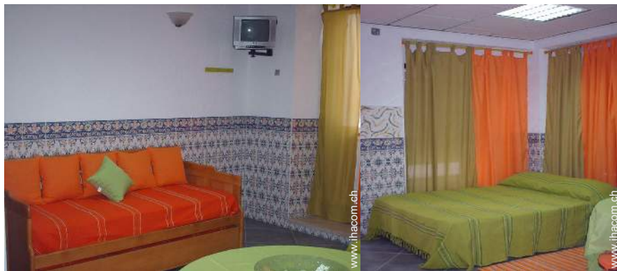
Ausziehbett(en) 1 Person