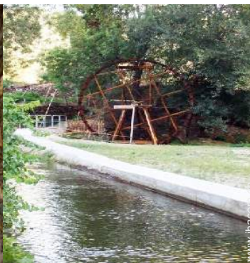
Blick auf Fluss