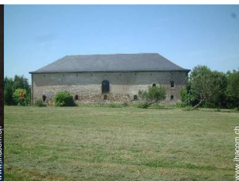
Blick auf Wiese