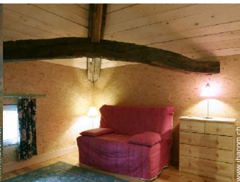
Schrankbett(en) 2 Personen