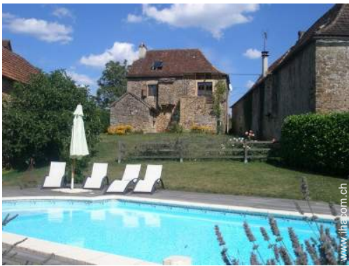
Charakterhaus mit Charme