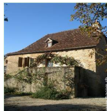
Charakterhaus mit Charme