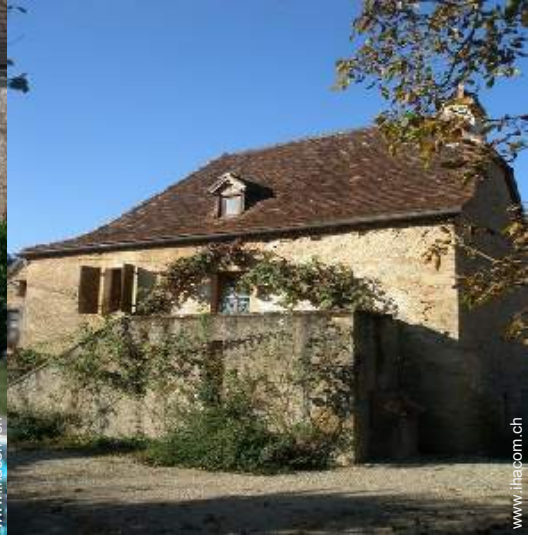
Charakterhaus mit Charme