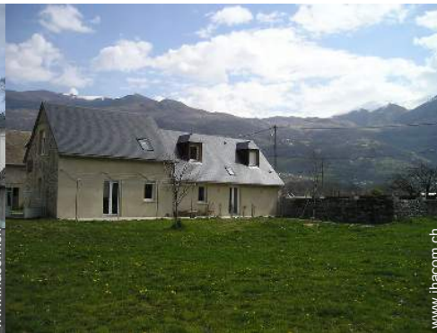
Blick auf Wiese