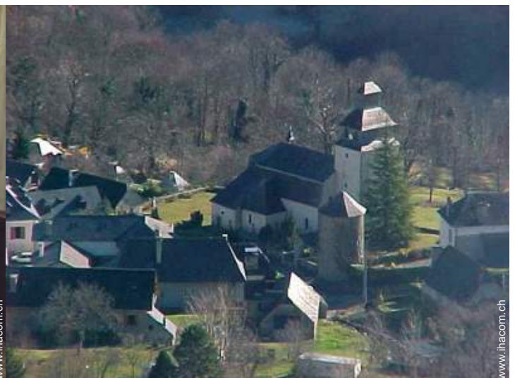
Blick auf Dorfzentrum