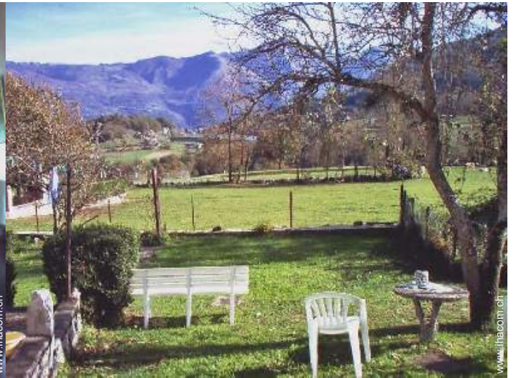
Blick auf See