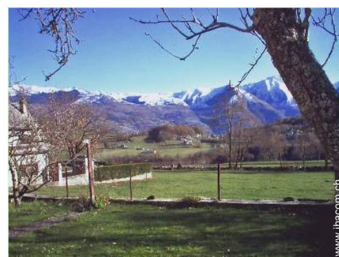
Blick auf Gebirge