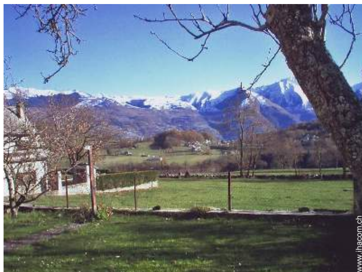
Blick auf Gebirge