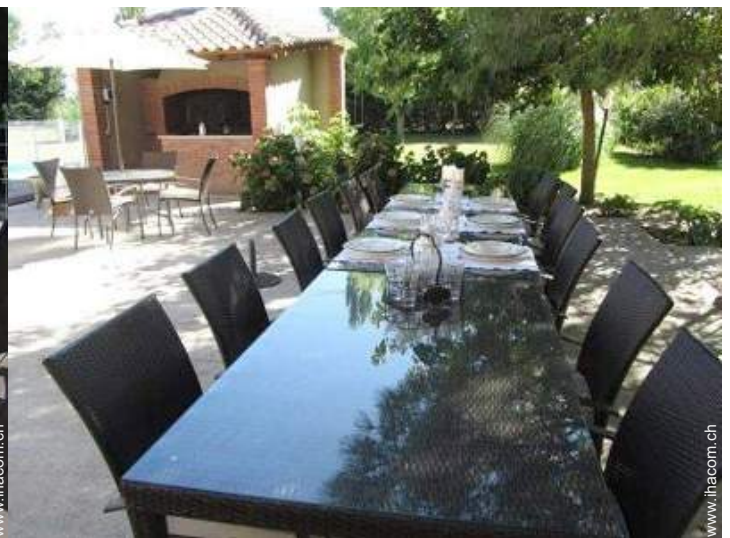
Außenausstattung zur Verfügung der Gäste