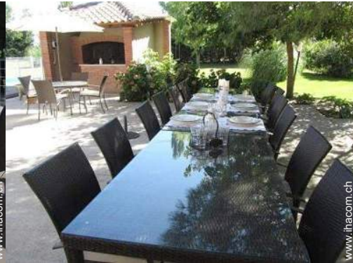
Außenausstattung zur Verfügung der Gäste