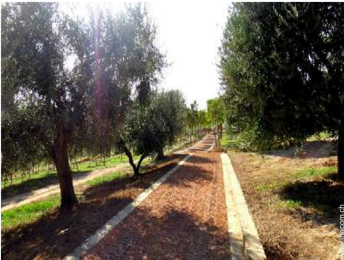
Park und Garten