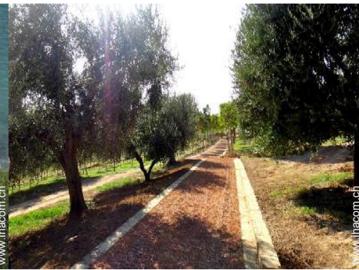
Park und Garten