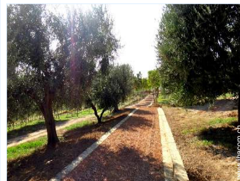
Park und Garten