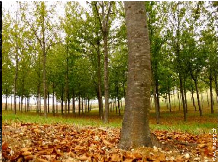
Park und Garten