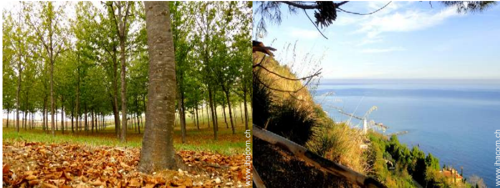
Park und Garten