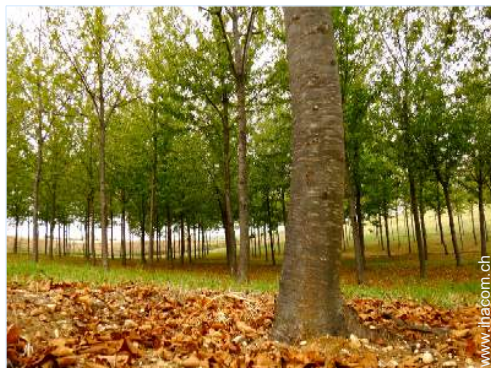
Park und Garten