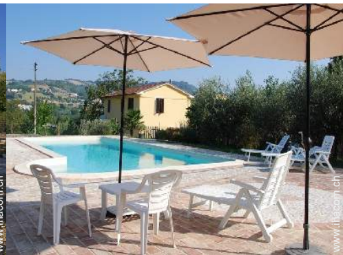
Außenausstattung zur Verfügung der Gäste