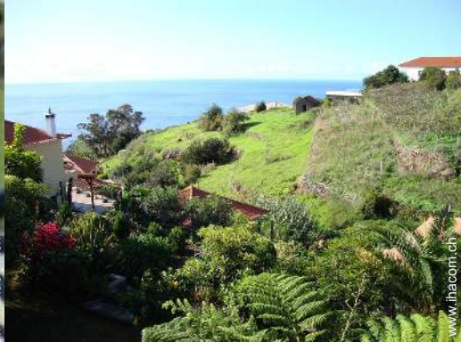
Blick auf Ozean