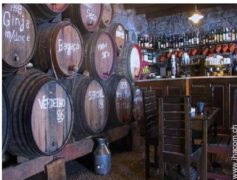
Weinkeller und Weindegustation