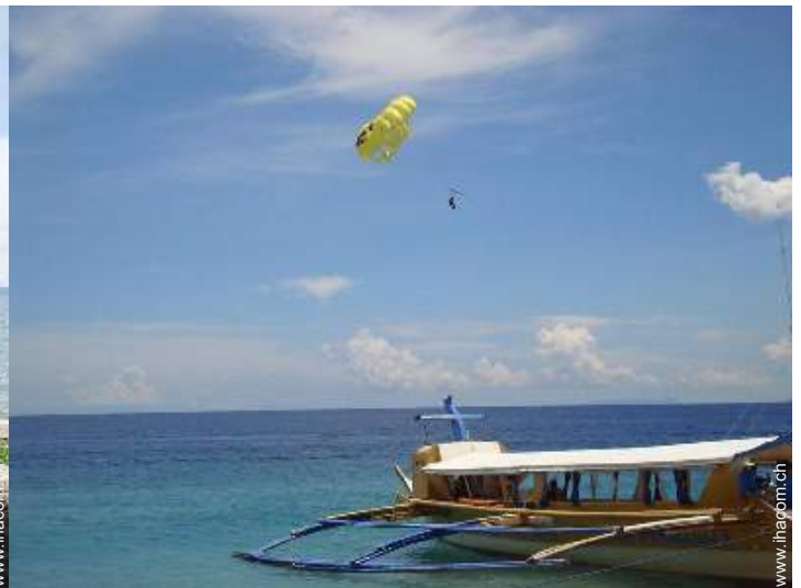
Badevergnügen in der Nähe