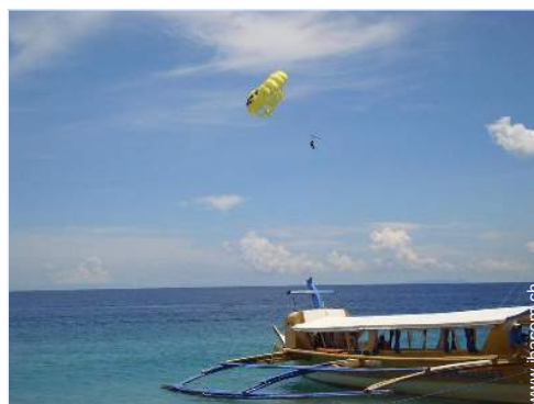
Badevergnügen in der Nähe