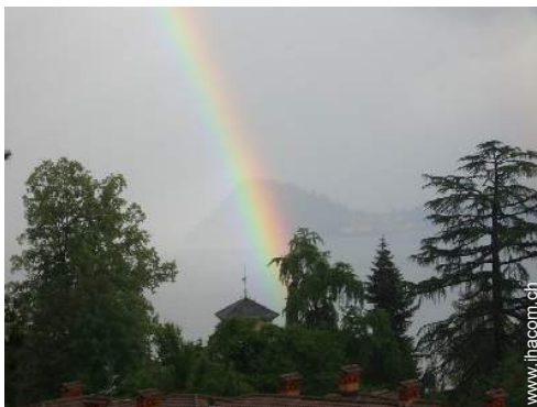
Blick auf See