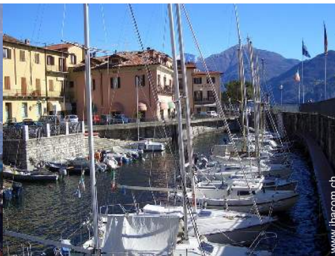
Helling für Boote