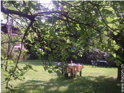
Park und Garten