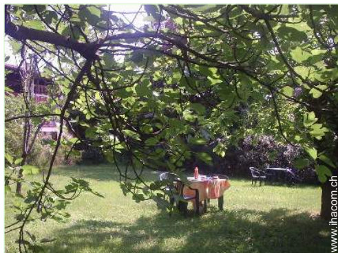
Park und Garten