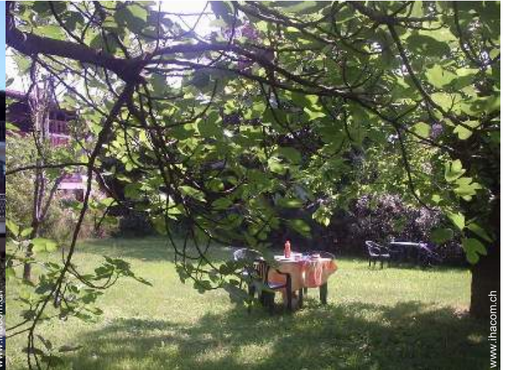
Park und Garten