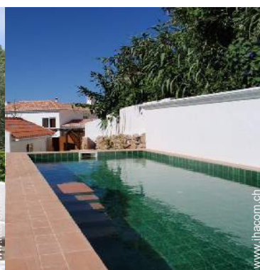
Außenausstattung zur Verfügung der Gäste