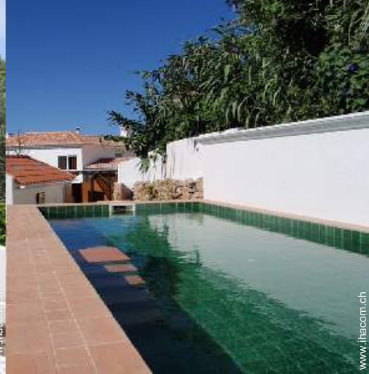
Außenausstattung zur Verfügung der Gäste