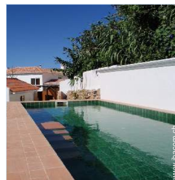
Außenausstattung zur Verfügung der Gäste