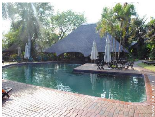
Swimmingpool in Wohnanlage