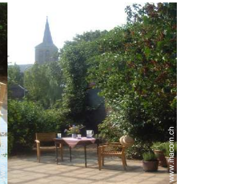
Blick auf Denkmal