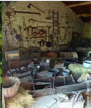
Antiquitäten & Trödel