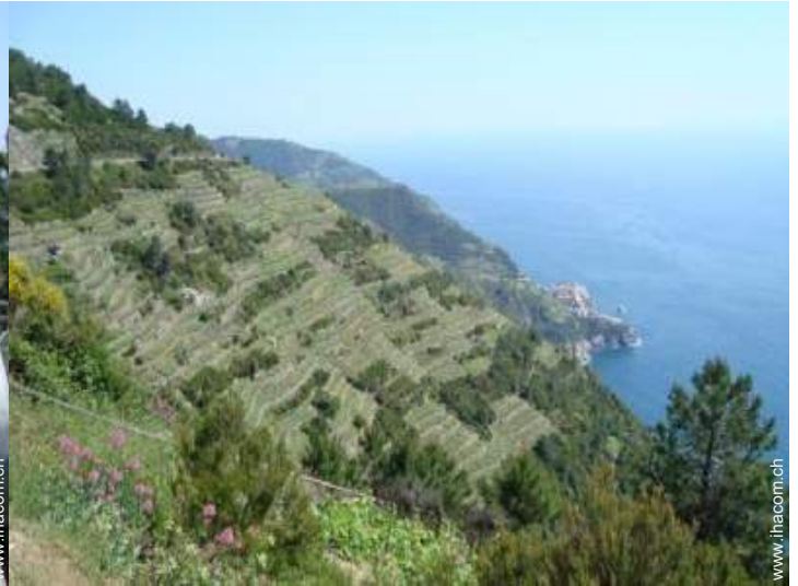
Blick auf Weinberge