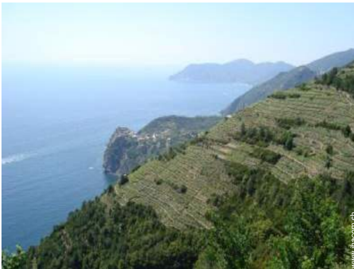
Blick auf Weinberge