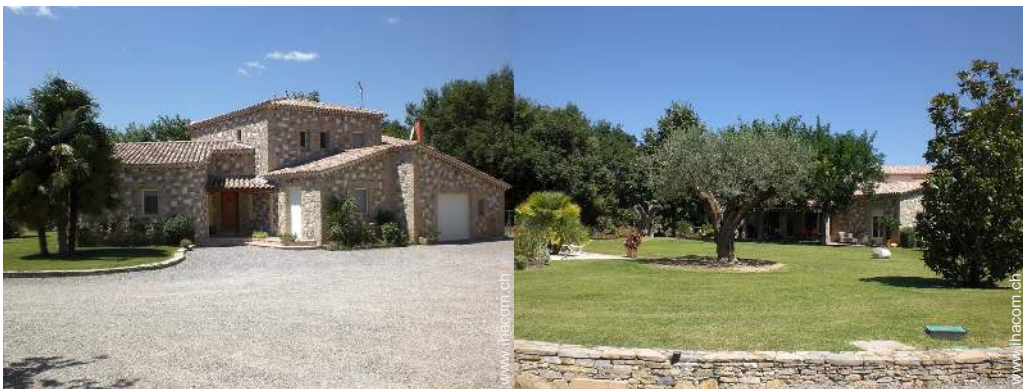
Villa mit Charme