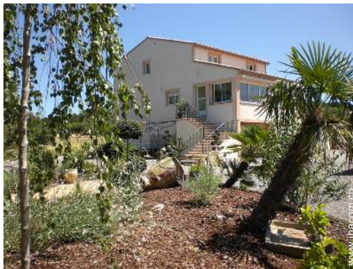
Villa mit Charme