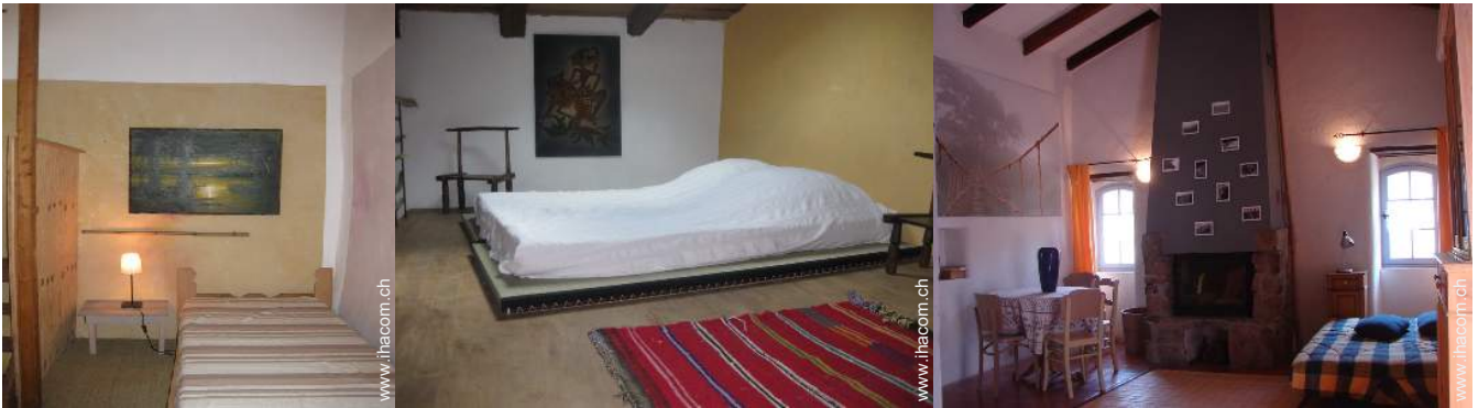
Futon(s) 2 Personen